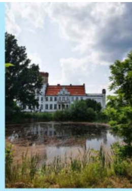
DaVinci 3 Coworking & Culture in Wroclaw